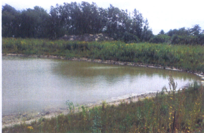
Zbiornik lęgowy dla płazów