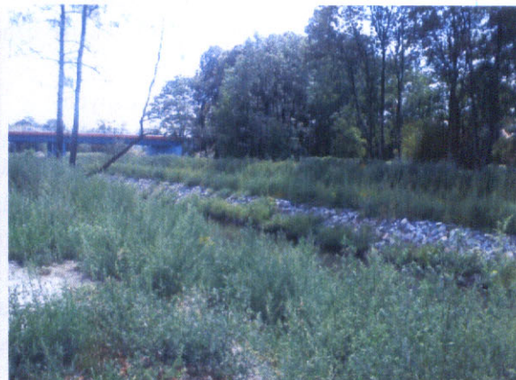
Wzmocnienie brzegów rzeki Kłodnicy